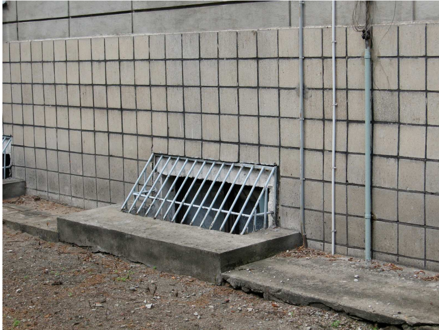
ZDJĘCIE NR 18 – ZEJŚCIE DO KOTŁOWNI.