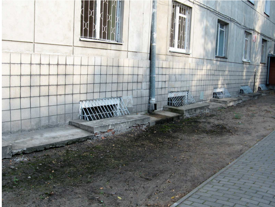
ZDJĘCIE NR 16