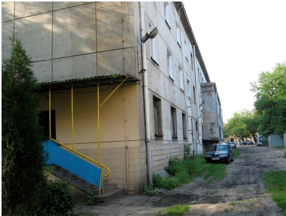
ZDJĘCIE NR 12 - ZEJŚCIE DO KOTŁOWNI.