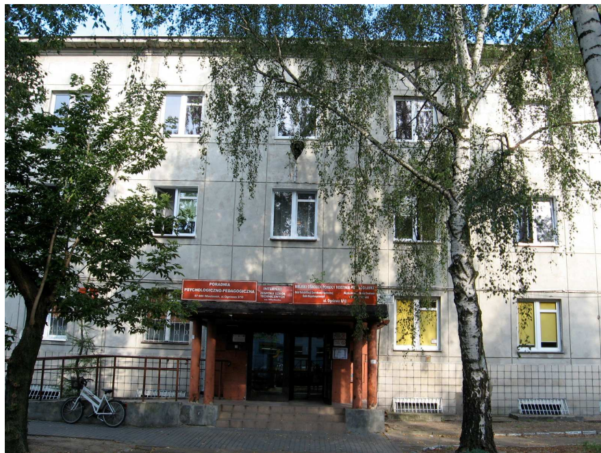
ZDJĘCIE NR 7 – WEJŚCIE GŁÓWNE