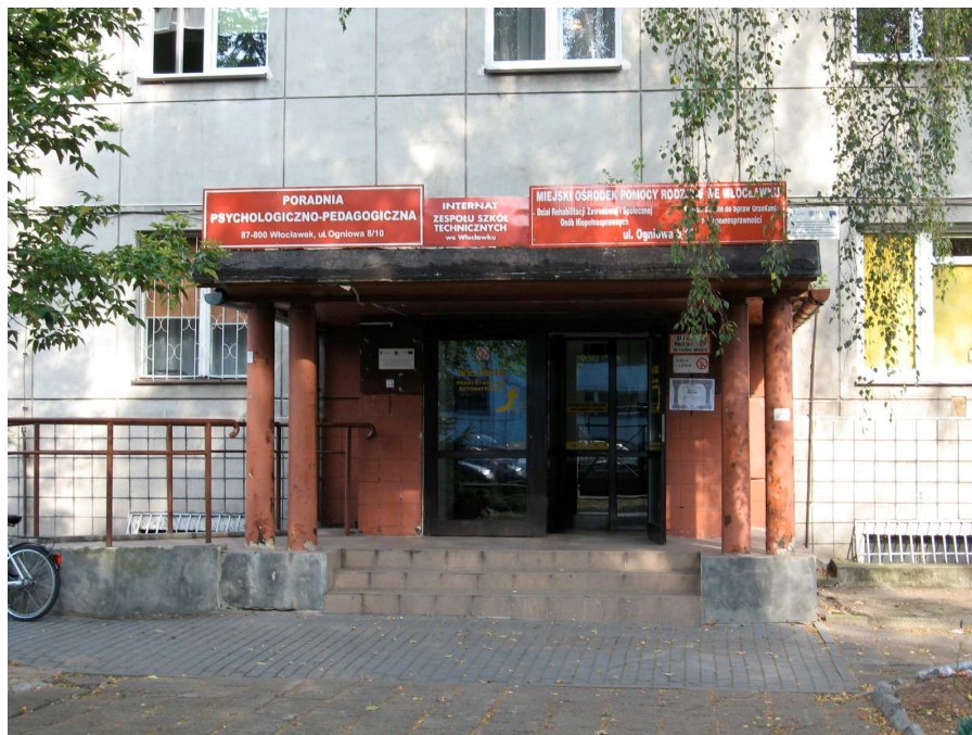
ZDJĘCIE NR 6 - ELEWCJA POŁUDNIOWO – WSCHODNIA – CZĘŚĆ PO INTERNACIE